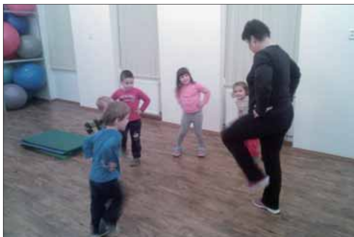
Hrátky s našimi robátky