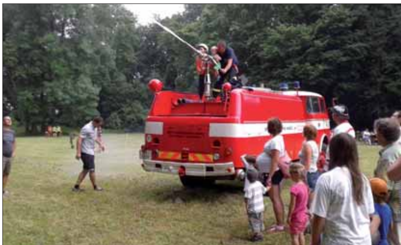
Dětský den 2014