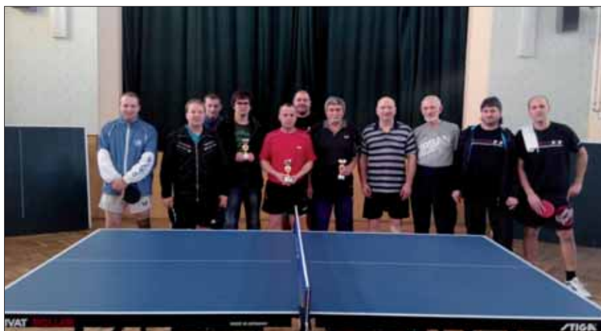
Štěpánský turnaj ve stolním tenise 2014