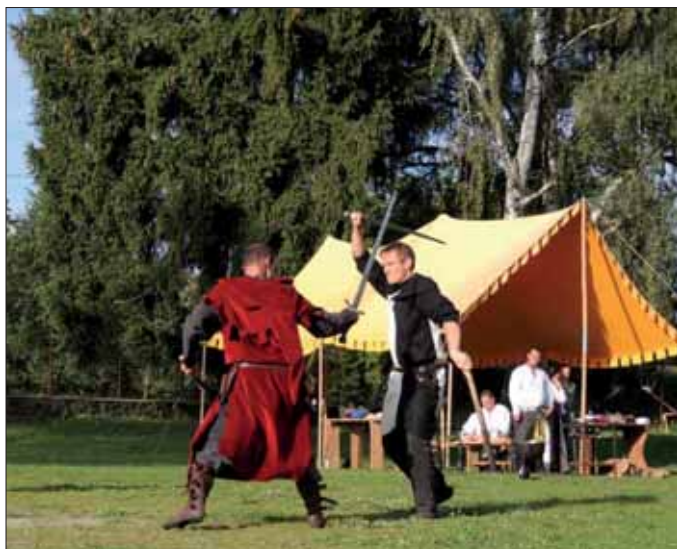
Historický den 2014

Autor: Dušan Koc, starosta T.J. Sokol Plaveč, www.sokolplavec.cz