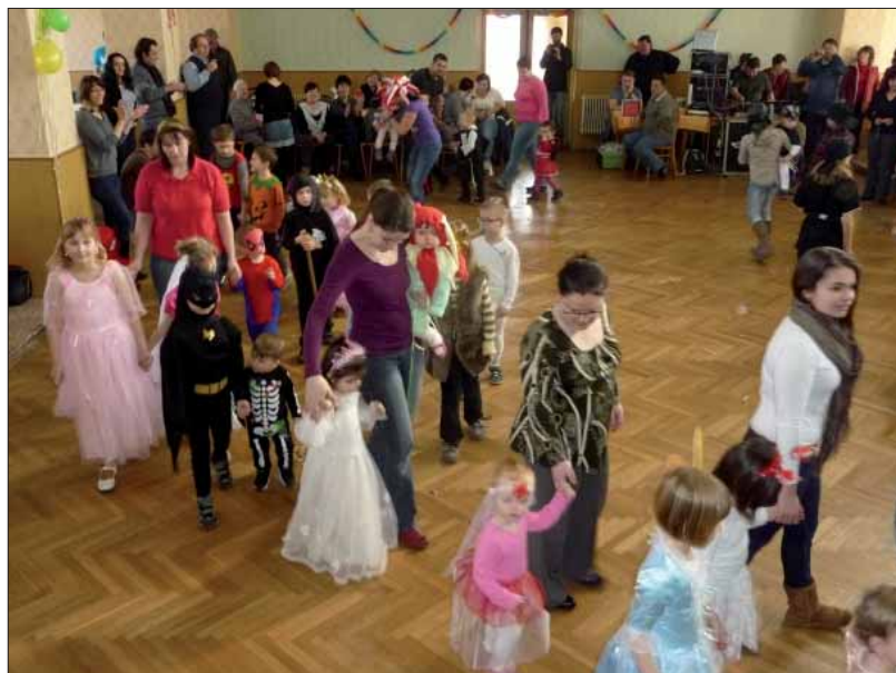
Dětský karneval 2014

hodiny zapojují. Vše probíhá zábavnou a sportovní formou. Připojit se k nám můžete každé úterý od 17h v budově mateřské školy . Cvičení bude probíhat pouze v zimním a jarním období. Poplatek na půl rok činí 150,-Kč za dítě. Děti registrované v sokolu mají cvičení za 100,- Kč. Cílem je především seznámit a rozpohybovat ty nejmenší z nás a efektivně tak využít jejich volný čas.